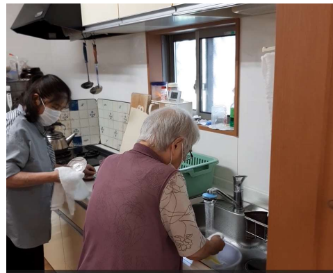
今日の仕事を自分で選んで 生活リハに繋がります