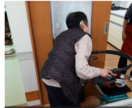
配膳 下膳も出来る方は自分で行います これが日常の中で行う生活リハビリ