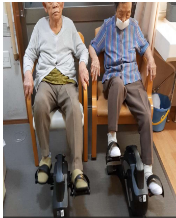
自転車漕ぎにも挑戦