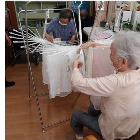
出来る事は自分で